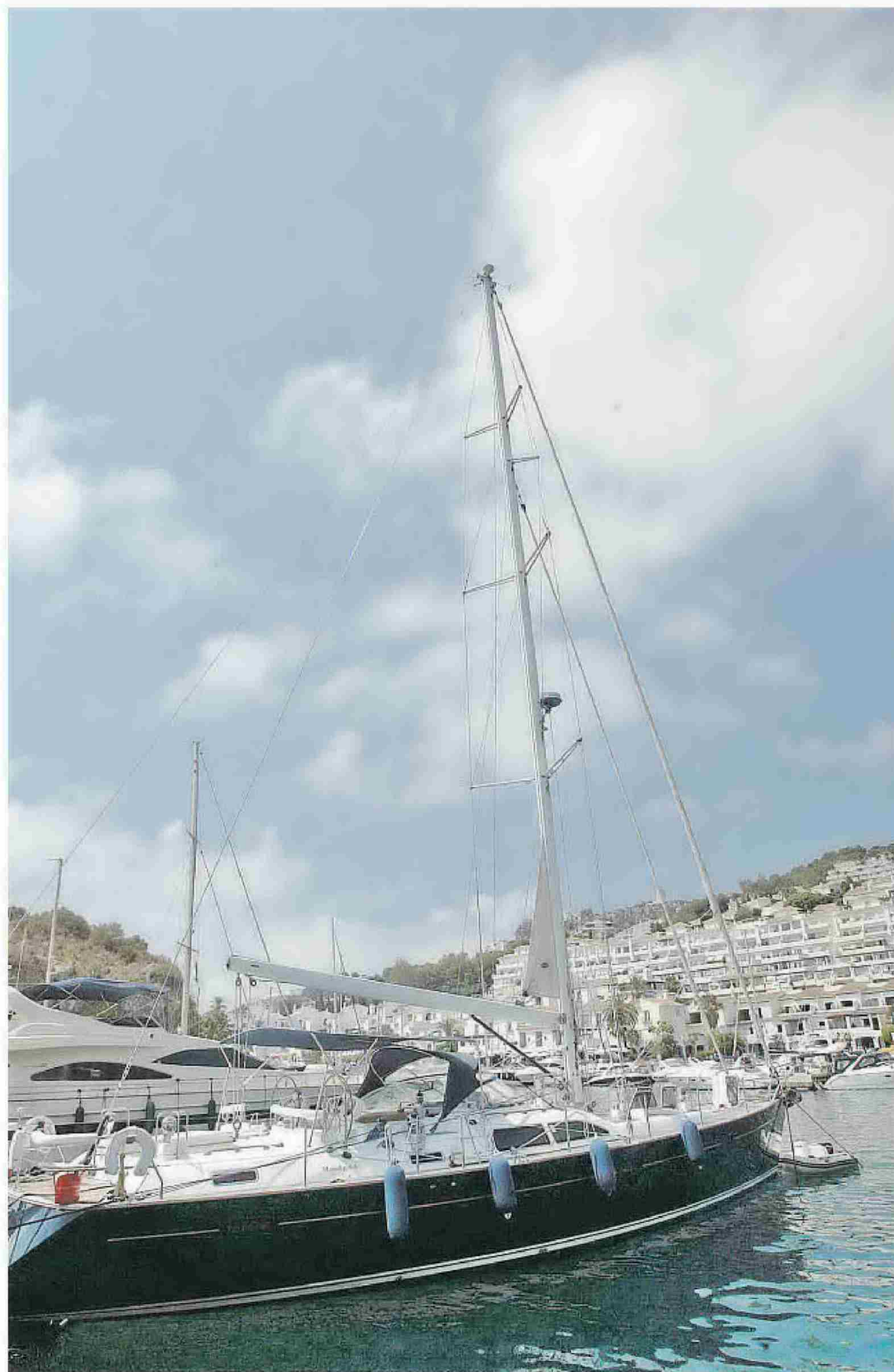
Los usuarios de los pantalanes deportivos se quejan del alto precio de los atraques. JAVIER MARTÍN

► La Asociación de Puertos critica que las instalaciones públicas no compiten al mismo nivel que las privadas